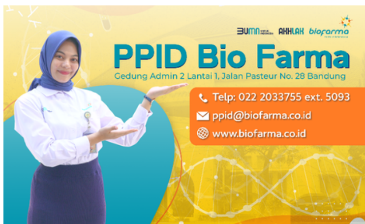
Gambar: Ruangan PPID Bio Farma dan flyer PPID Bio Farma