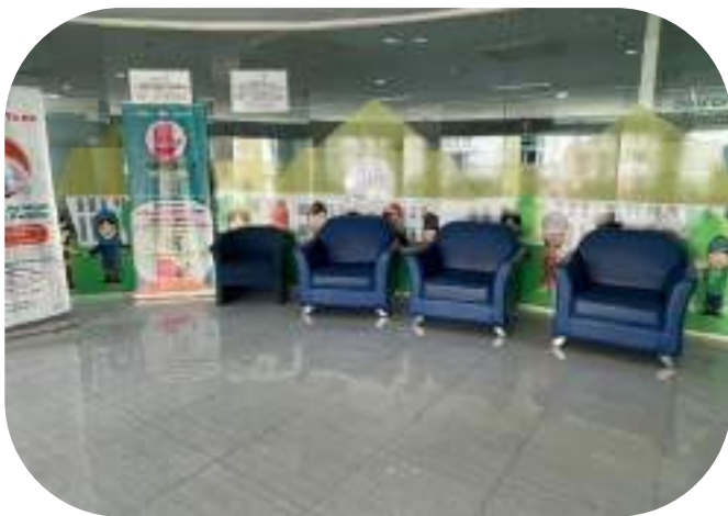
Gambar 1: Ruang Tunggu Tamu 1

Untuk menunjang pekerjaan pelayanan informasi publik, Bio Farma menyediakan ruangan khusus untuk menerima kunjungan langsung untuk pengajuan permintaan informasi publik. Ruangan pelayanan informasi publik di PPID Bio Farma berada di Ruang Pelayanan Publik Bio Farma, di Jl. Pasteur no. 28, Gedung Administrasi II, Lantai 1