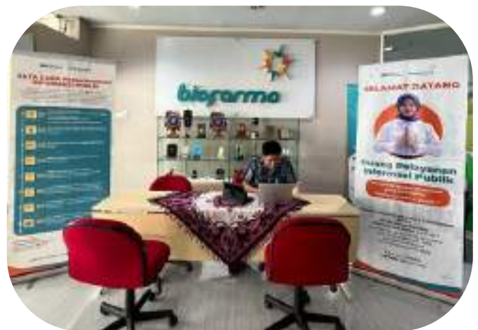
Gambar 4: Akses Komputer/laptop dengan internet