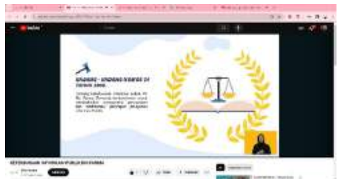
Gambar 6: Website PPID Bio Farma yang telah dilengkapi fitur aksesibilitas talkback dan video perusahaan dengan interpreter bahasa isyarat