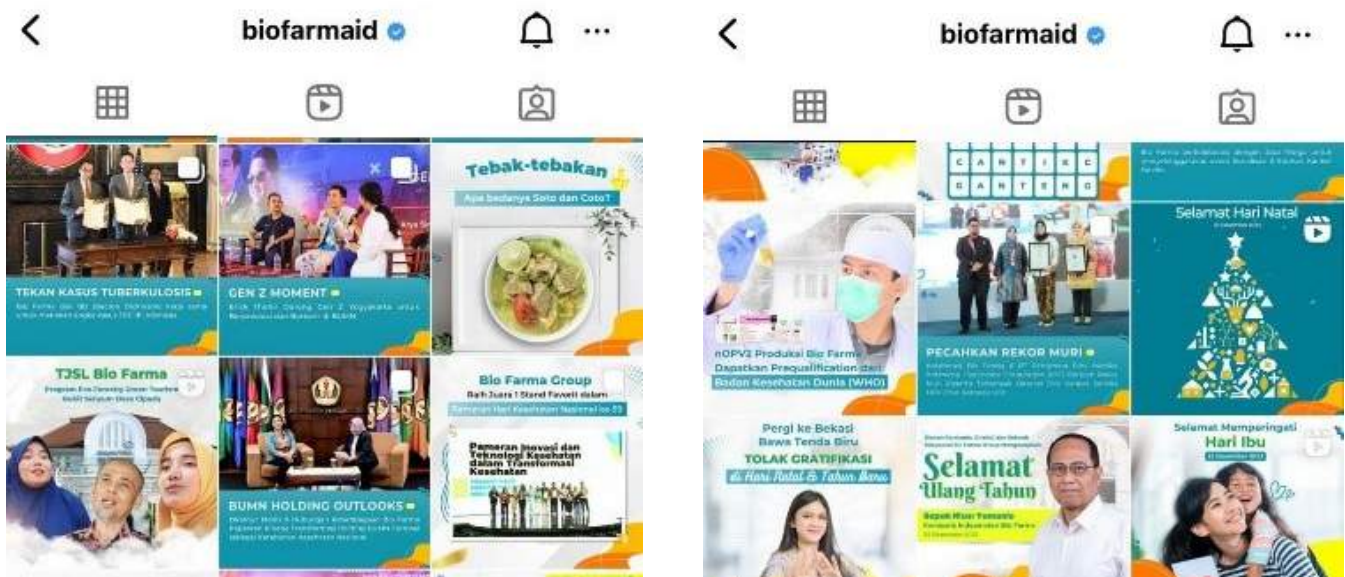
Gambar 7: Platform Medsos Instagram Bio Farma

PPID Bio Farma melalui Departemen Komunikasi Perusahaan Bio Farma juga aktif menyampaikan informasi-informasi terkait perusahaan melalui media sosial perusahaan @biofarmaid. Sarana penyediaan informasi perusahaan tidak hanya secara reaktif menunggu permohonan, tapi juga secara proaktif disampaikan secara rutin.