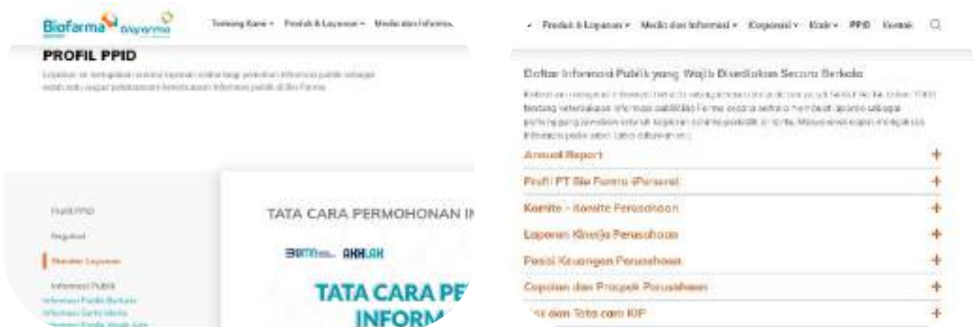
Gambar 8: Tampilan Website E-PPID Bio Farma

Untuk melakukan permintaan informasi, masyarakat dapat langsung mengisi formulir permintaan informasi di website tersebut.