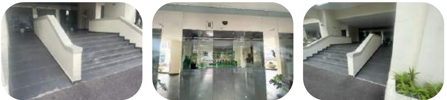
Gambar 5: Akses Ramp dan Pintu Gedung dengan Automatic Sliding Door

Bagi pemohon informasi yang berstatus penyandang disabilitas yang ingin datang secara langsung, PPID Bio Farma juga menyediakan fasilitas yang memudahkan akses bagi pemohon informasi dengan akses ramp untuk kursi roda dan automatic sliding door.