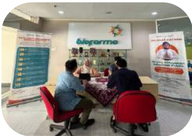
Gambar 3: Ruang Pelayanan PPID Bio Farma

Ruangan PPID Bio Farma dilengkapi dengan ruang tunggu tamu dan memiliki akses internet melalui jaringan wifi tamu. Tamu juga dapat mengambil formulir permintaan informasi di Ruang Tunggu.