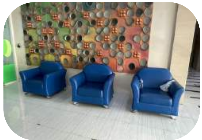
Gambar 2: Ruang Tunggu Tamu 2

Ruangan PPID Bio Farma dilengkapi dengan ruang tunggu tamu dan memiliki akses internet melalui jaringan wifi tamu. Tamu juga dapat mengambil formulir permintaan informasi di Ruang Tunggu.